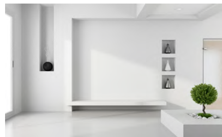
Vigones / shaft / marcos / dinteles