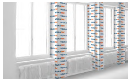
Vigas / recubrimiento de pilares / zócalos